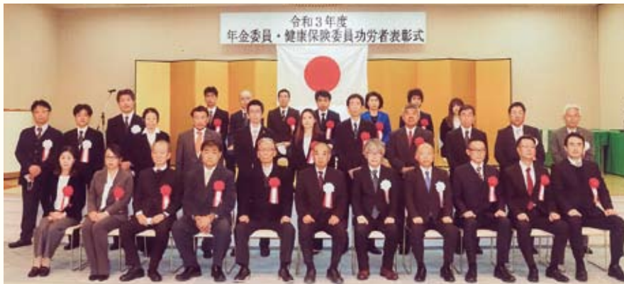
被表彰者記念写真

受賞された方々、誠におめでとうございます。ますますのご活躍をご祈念申し上げます。