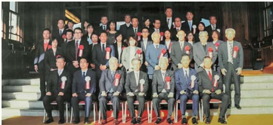
被表彰者記念写真

受賞された方々、誠におめでとうございます。ますますのご活躍をご祈念申し上げます。